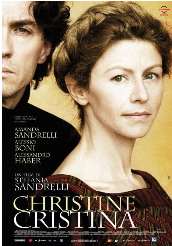
La locandina del film di Stefania Sandrelli su Cristina da Pizzano